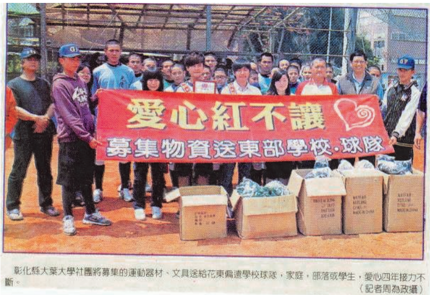
彰化縣大葉大學社團將募集的運動器材、文具送給花東偏遠學校球隊，家庭、部落或學生，愛心四年接力不斷。

賴同學說，「愛心全壘打」係針對東部區最缺乏的運動器材，因為東部是台灣運動選手孕育的根，但物資不足，他說，「愛心紅不讓」募集棒壘球練習用球四百五十粒，膠釘鞋一百四十雙，球套三十副，護具十套和文件夾、原子筆、滑鼠墊、便利貼、利可膠帶、膠水等，希望發揮拋磚引玉效益，帶動更多人、社團和企業加入。